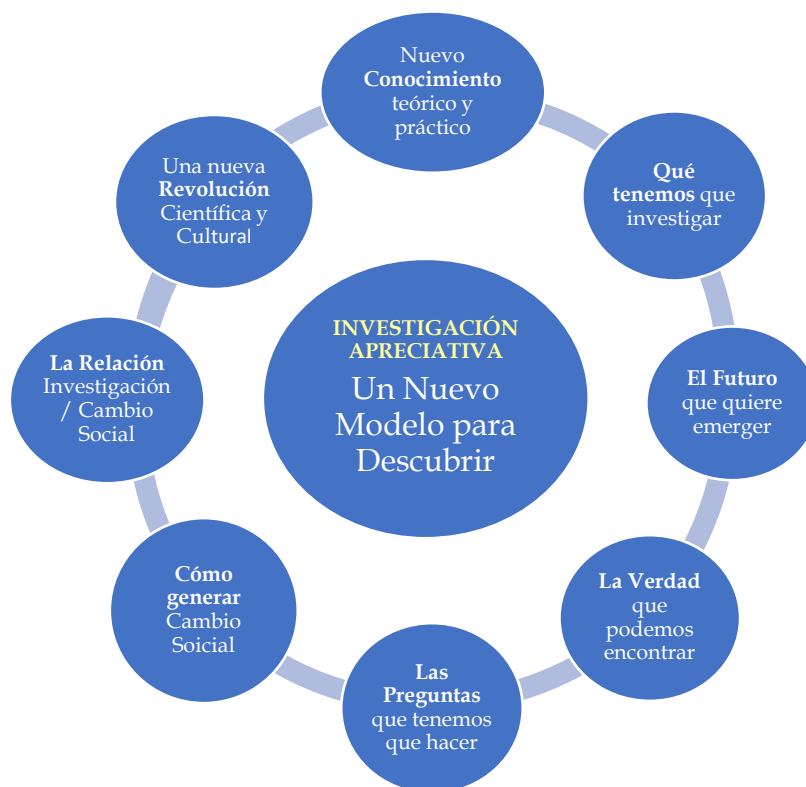
Gráfico 2 CARACTERÍSTICAS FUNDAMENTALES Y DISTINTIVAS DE LA INVESTIGACIÓN APRECIATIVA