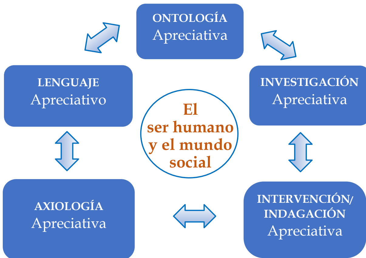
Gráfico 1 COMPONENTES DEL PARADIGMA APRECIATIVO