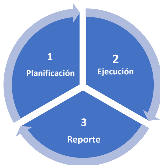
Gráfico 5 FASES DE LA REALIZACIÓN DE LA INVESTIGACIÓN APRECIATIVA

Apreciativa tiene tres fases fundamentales. La primera es la fase de planificación o propuesta de investigación , la segunda la fase de ejecución , y la tercera la fase de creación del reporte final y/o del documento para ser presentado y publicado.