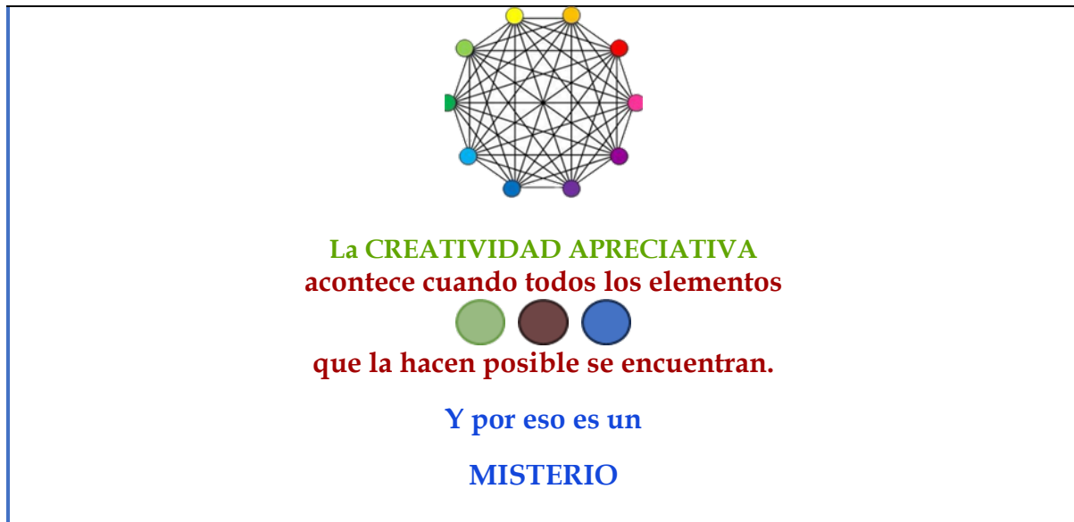
Gráfico 3 TEORÍA DEL ENCUENTRO DE LA CREATIVIDAD

Y termino esta sección con unas reflexiones sobre el tema de cómo diferenciamos una buena teoría de otra que no lo es. ¿Existen criterios universalmente aceptados por científicos y académicos? La respuesta es no, pero si existen ciertos criterios que son asumidos como condiciones necesarias para poder evaluar la validez y el poder de una teoría. Entre estas condiciones está el que el proceso de creación de la teoría haya sido riguroso en todas sus fases, tal como lo he presentado en secciones anteriores. Otra condición sería que la teoría se relacione con la información empírica recogida. Pero, también hay otras condiciones que retan a las que tradicionalmente se han asumido como las únicas y mejores, como las que propone Cooperrider cuando dice que estas serían las preguntas que también tenemos que hacernos a la hora de evaluar una teoría: “¿Hasta qué punto esta teoría presenta nuevas posibilidades provocativas para la acción social y hasta qué punto estimula la normativa del diálogo sobre cómo podemos y debemos organizarnos?” (Cooperrider, 2021, p. 66).