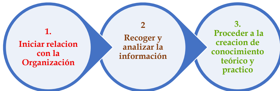
Gráfico 7 FASE DE LA EJECUCIÓN DE LA INVESTIGACIÓN