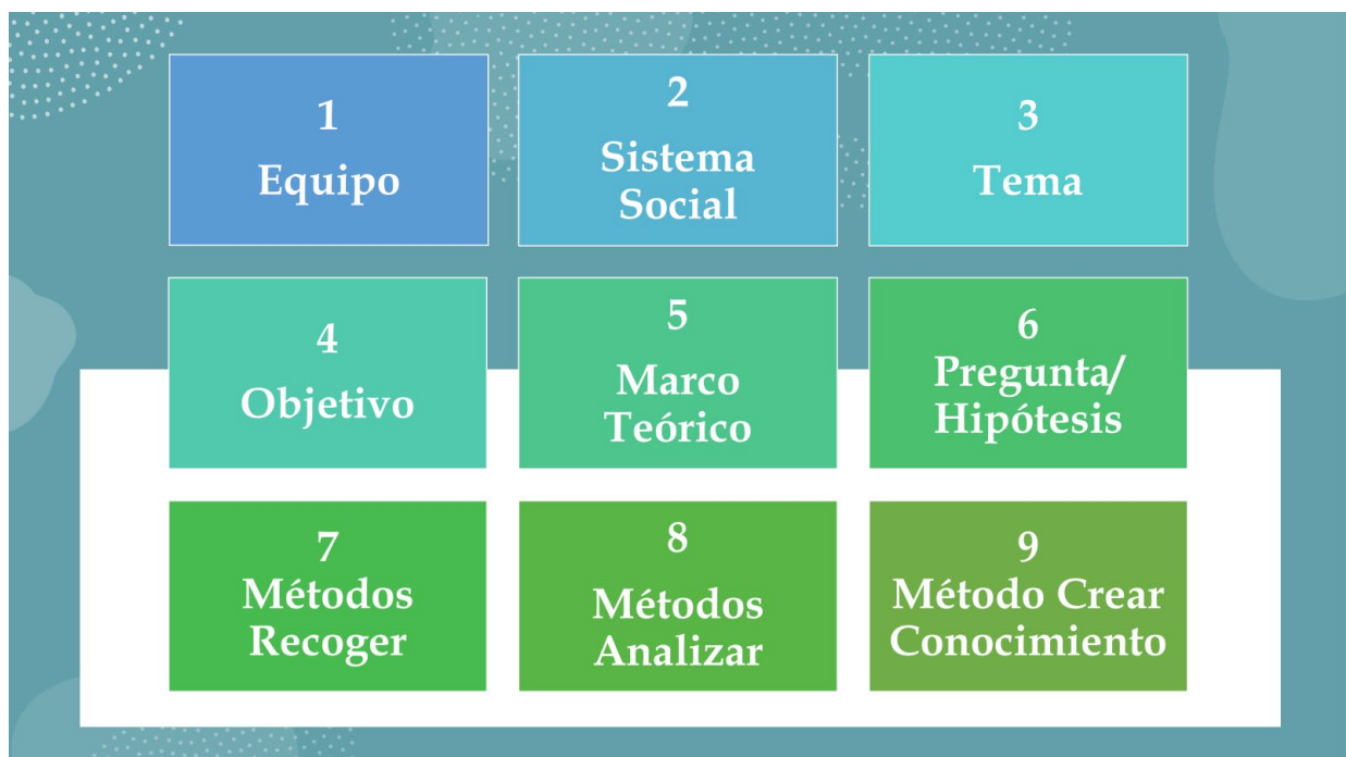
Gráfico 6 FASES DE LA PLANIFICACIÓN DE LA INVESTIGACIÓN APRECIATIVA

La lista y el orden de estas actividades, que propongo como una hoja de ruta básica y orgánica, son por supuesto susceptibles de todo tipo de cambio y adaptación.